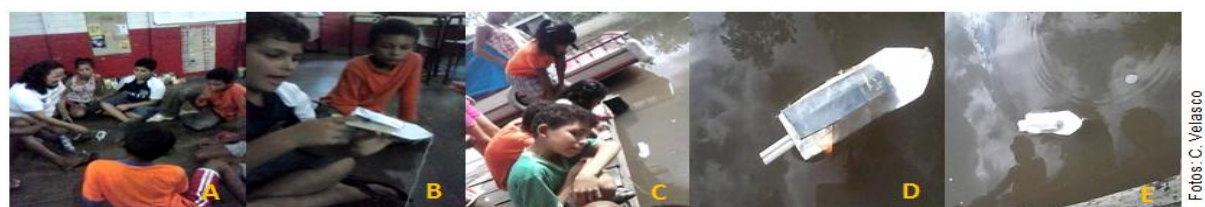
Figura 2: Modelo de embarcação com dispositivo de lata e uso de vela; a roda de conversa/trabalhando os conceitos (A e B); testando o modelo no rio (C, D e E).

Os estudantes motivados e animados inferiram que, o que fazia o barco com o dispositivo de lata se mover era a água, que esquentava e saía pelo canudinho; no caso do outro modelo com uso de balão, relacionaram o movimento do barco à água e ao ar que saía do balão pelo canudinho.