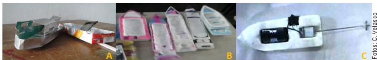
Figura 3: Modelos de embarcações feitos em sala de aula, com embalagens de leite e dispositivo de lata (A) e modelos feitos em casa com auxílio dos pais, de isopor (B) e com motor a pilha de brinquedo eletrônico (C),

A culminância do trabalho ocorreu em uma grande roda de conversa, em que os estudantes para nossa surpresa apresentaram novos barquinhos e seus aprendizados. Surgiram barquinhos diversos (pintados, enfeitados) sendo alguns construídos com a ajuda dos pais. Um dos barquinhos apresentados funcionava com um pequeno motor retirado de um brinquedo eletrônico. Percebeu-se que os estudantes em casa e na escola continuaram a criar e a comentar sobre a atividade.